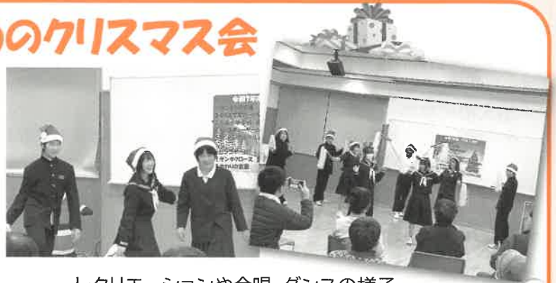
レクリエーションや合唱・ダンスの様子

クリスマスカードの交換や、児童生徒による合唱、ダンス、レクリエーションで楽しく交流することができました。