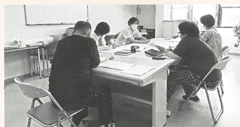
地域資源リスト作成のためのミーティング

支援や介護を必要とする高齢者に詳しく、その人らしい暮らしをサポートしているケアマネジャーから、いま地域で求められている支え合いの仕組みやサービスについて聞くことや、生活支援コーディネーターが知る地域のお宝を共有することで、より安心して生活できる地域づくりを目指すことができます。